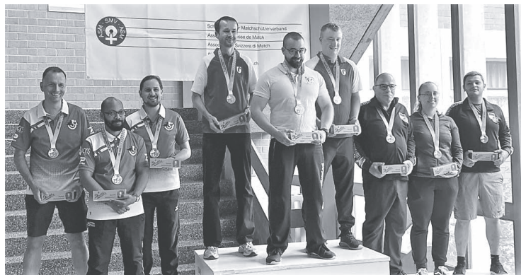
Unsere Gratulation an das Baselbieter C-Team Elite !

Beim anschliessenden Schnellfeuerteil konnten die drei Baselbieter ihr gewohntes Können umsetzen. Sie nahmen hier den Waadtländern 19 Punkte ab. Dieser grosse Effort brachte sie schlussendlich auf den 1. Schlussrang und Goldmedaille. Mit sechs Punkten Rückstand mussten sich die Waadtländer mit dem 2. Schlussrang zufrieden geben.